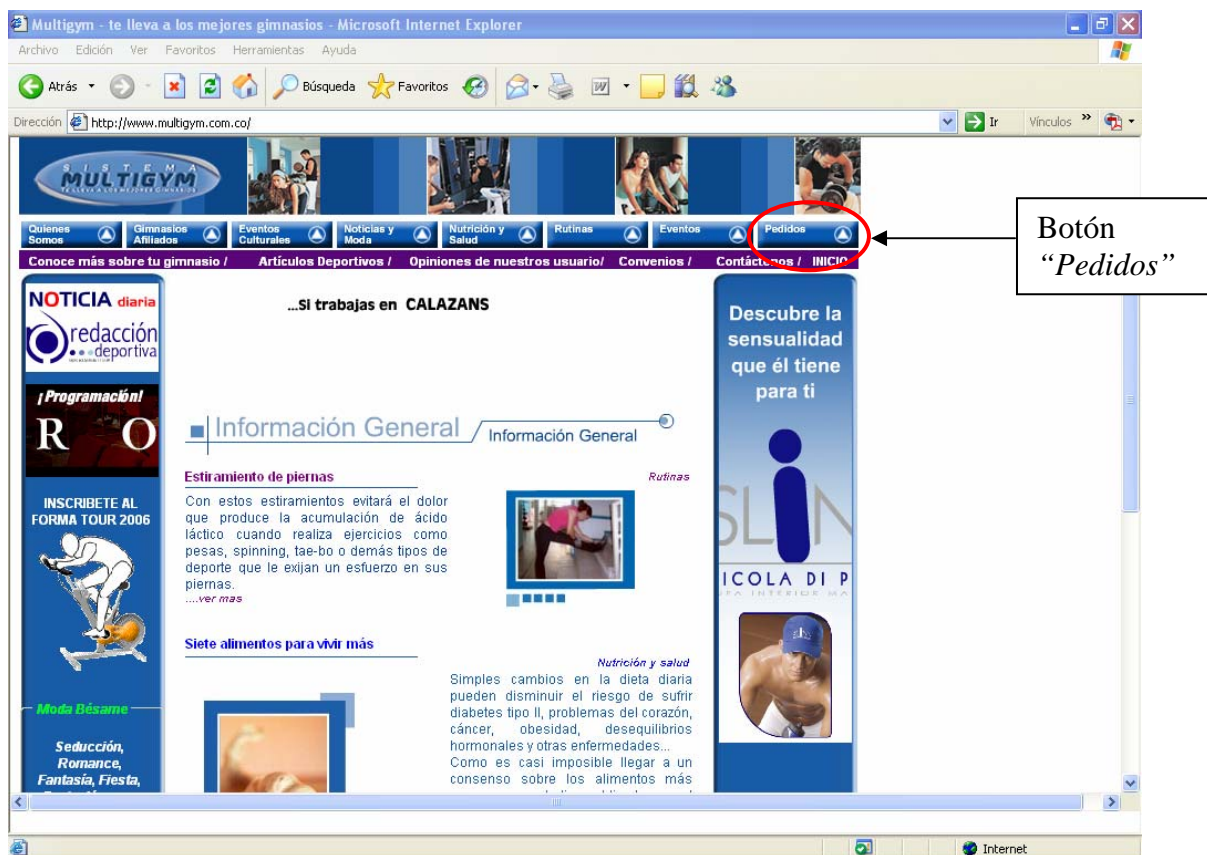
Página de inicio